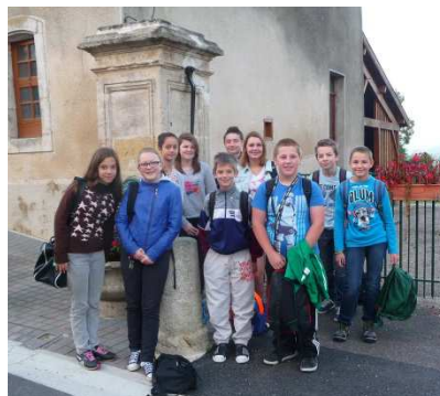
nos collégiens au bus

Effectifs Collège (départ à 7h40) : 13 (4 classes) Effectifs primaire (départ 8h40) : 16 (5 classes) Effectif maternelle (départ 8h40) : 7 (3 classes)