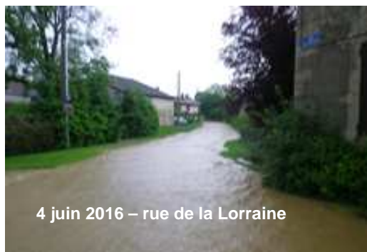
4 juin 2016 – rue de la Lorraine

Une météo « extra-ordinaire », des potagers et des cultures misérables, des espaces verts difficiles à entretenir, des intempéries destructrices... cette année 2016 fera malheureusement date dans notre histoire villageoise.